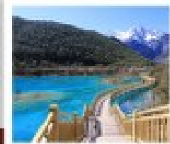
น้ำพุร้อน