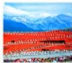
ไร่ดอกหงอนนาค