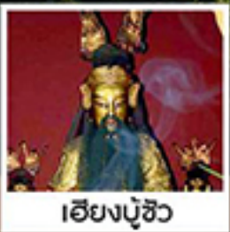
เอียงบู๊ซิว