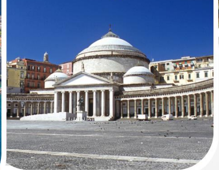
Piazza del Plebiscito