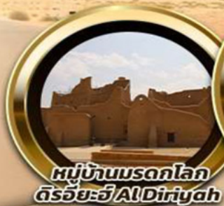
หมู่บ้านมรดกโลก ดิริยะฮ์ Al-Diyah

บินหรู อยู่สบาย เทียบชิด ชิด 10 ท่าน คอนเฟิร์มเดินทาง