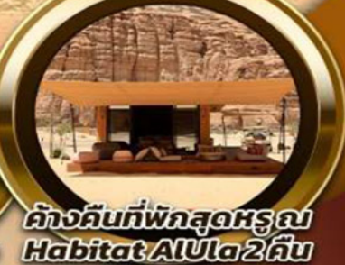
ค้ำคืนที่พักสุดหรู Habitat AlUla 2 คืน

📍 พิเศษ!! รับประทานอาหาร ณ ภัตตาคารอาหารไทย สุดหรูและไฮโซ @Saffron Banyan Tree AlUla