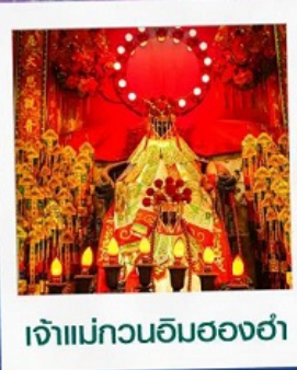
เจ้าแม่กวนอิมสองฮา