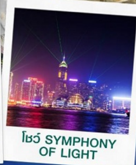
โชว์ SYMPHONY OF LIGHT