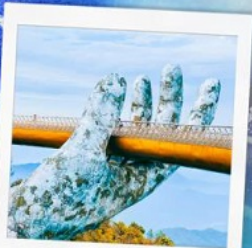
บาน่าฮิลล์