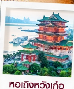
หอถึงหวงเก้อ