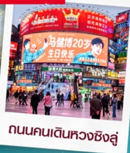
ถนนคนเดินหวงซิงสู