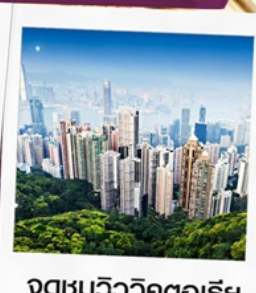
จุดชมวิวกตอเรีย