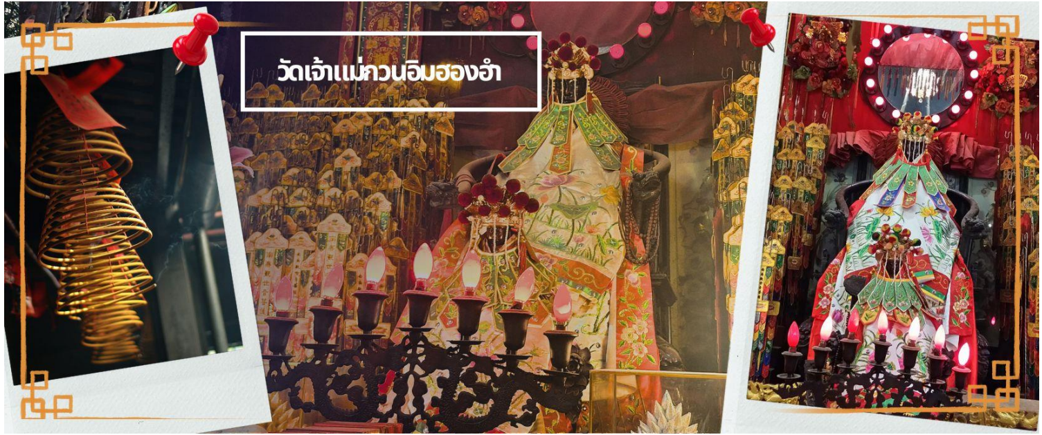
วัดเจ้าแม่ทวนอิมฮ่องกง

จากนั้นนำท่านชม โรงงานจิวเวอรี่ ซึ่งเป็นโรงงานที่มีชื่อเสียงที่สุดของฮ่องกงในเรื่องการออกแบบเครื่องประดับ อาทิเช่น จี้ และแหวนกำหันทัน ที่สวยงามโดดเด่นไม่เหมือนใคร ซึ่งถือกำเนิดขึ้นที่นี่และมีชื่อเสียงที่สุดใช้เป็นเครื่องประดับติดตัว และเสริมดวงชะตา สินค้าทุกชิ้นมีเอกสารรับประกันคุณภาพเปลี่ยน ซ่อม ใต้ตลอดอายุการใช้งาน หากเกิดการชำรุดจากสินค้าไม่ใช่อุบัติเหตุ และนำท่านเลือกซื้อ เครื่องประดับที่ ร้านหยก ซึ่งคนจีนนั้นถือว่าหยกเป็นหิน ที่เป็นตัวแทนของความสวยงามและความบริสุทธิ์ มีความเชื่อว่าหยกมงคล ถ้าพกติดตัวไว้จะอายุยืนและสุขภาพดี