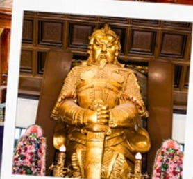
วัดเขากงหมิว