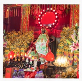
เจ้าแม่กวนอิมสองฮา

จัดเต็มที่ฮ่องกงดิสนีย์แลนด์ ตื่นตากับความลับแห่งป่าเอเรนเดลล์ และ FROZEN ZONE