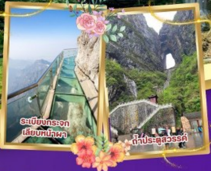
ระเบียงกระจก เลียบหน้าผา