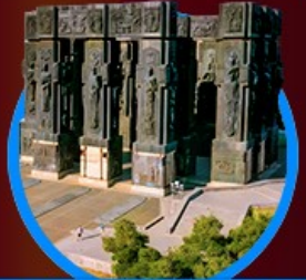
อนุสาวรีย์ประวัติศาสตร์