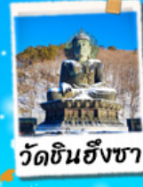
วัดชินฮังซา