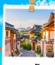
มูกซอนฮันอก