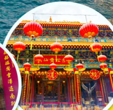
วัดเขวังต้าเซียน