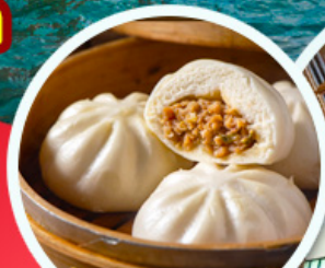
ติ่มซำฮ่องกง