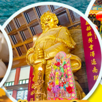
วัดเขากงเมี้ยว