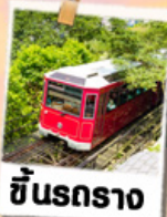
ซินรถราง