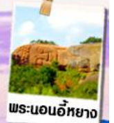
พระนอนอึ้งหยาง