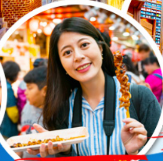
ตลาดควางจ้ง