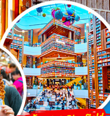
ห้องสมุด Starfield