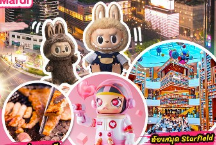
หมูย่างเกาหลี