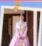
ใส่ชุดฮันบก