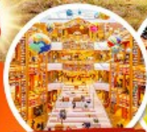
ห้องสมุดสตาร์ฟิชต์

• พิเศษ!! โซลชูดฮันบกเดินวัง + ถนนสายโรแมนติกที่อกซุกุง