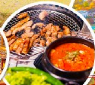
ตัวอย่างเกาหลี