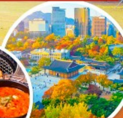
พระราชวังเคียงอกซุกุง