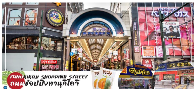
TANUKIKOJI SHOPPING STREET ถนนช้อปปิ้งทานุกิโคจิ

จากนั้นนำท่านสู่ ถนนช้อปปิ้งทานุกิโคจิ (Tanukikoji Shopping Street) เป็นย่านการค้าเก่าแก่ของเมืองซัปโปโร โดยมีพื้นที่ทั้งหมด 7 บล็อก ภายในนอกจากจะเป็นแหล่ง รวมร้านค้าต่างๆ อย่างร้านขายกิโมโน เครื่องดนตรี วิดีโอ โรงภาพยนตร์ แล้ว ยังมีร้านอาหารมากมาย ทั้งยังเป็นศูนย์รวมของเหล่าวัยรุ่นด้วย เนื่องจากมีเกมเซ็นเตอร์ และตู้หนีบตุ๊กตามากมาย ร้านดองกิ ร้าน 100 เยน นอกจากนั้นที่นี้ยังมีการตกแต่งบนหลังคา