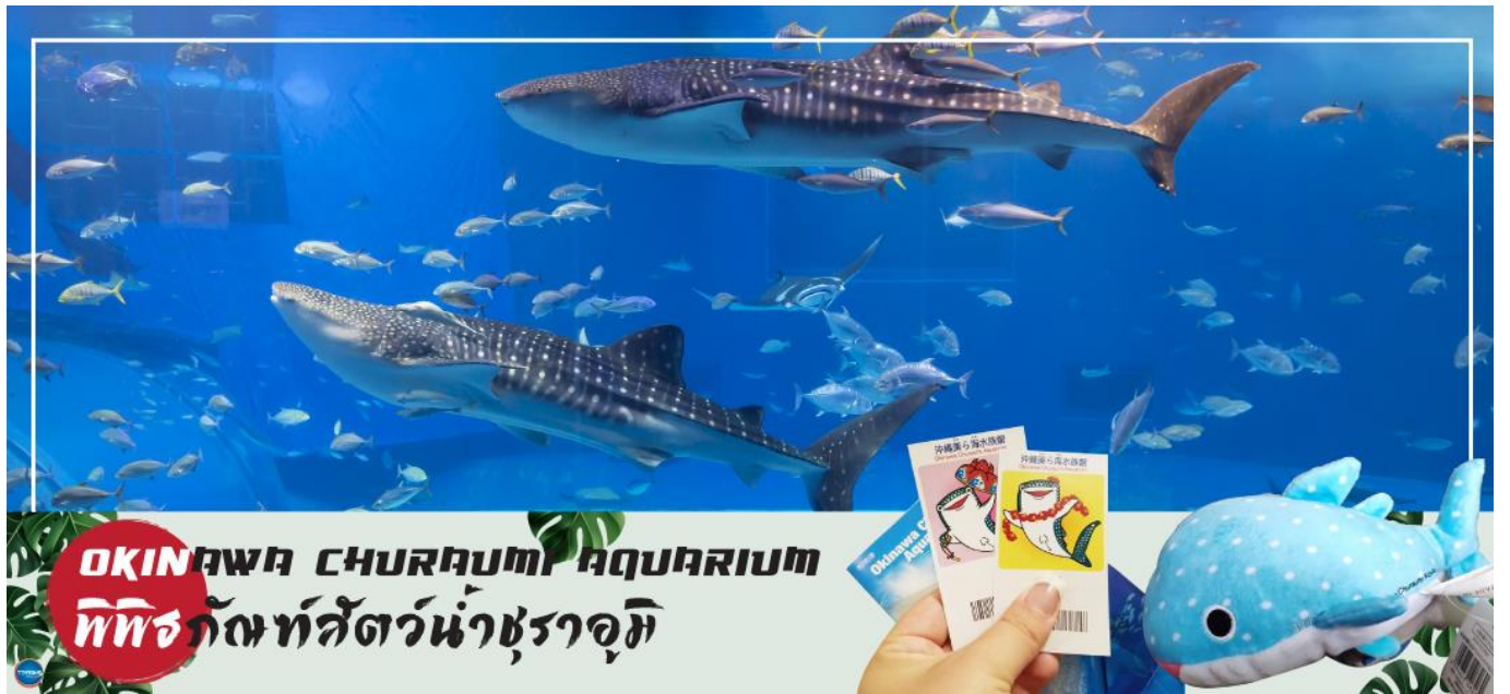
OKINAWA CHURAUMI AQUARIUM พิพิธภัณฑ์สัตว์น้ำชราอุมิ

เช้า รับประทานอาหารเช้า ณ ห้องอาหารของโรงแรม (1) นำท่านชม พิพิธภัณฑ์สัตว์น้ำชราอุมิ (OKINAWA CHURAUMI AQUARIUM) (ใช้เวลาเดินทางประมาณ 1.40 ชั่วโมง) เป็นพิพิธภัณฑ์สัตว์น้ำที่ดีที่สุดในประเทศญี่ปุ่น ไฮไลท์!!! ของการเยี่ยมชมพิพิธภัณฑ์สัตว์น้ำแห่งนี้คือแทงก์น้ำโครชิโอะ ซึ่งเป็นหนึ่งใน แทงก์น้ำที่ใหญ่ที่สุดของโลก ซึ่งภายในนั้นเต็มไปด้วยสิ่งมีชีวิตในทะเลแถบโอกินาวาที่หลากหลาย สัตว์น้ำที่โดดเด่นที่สุดคือฉลามวาฬยักษ์ และกระเบนราหู อีสระให้ท่านได้เพลิดเพลินกับสัตว์น้ำหลากหลายชนิด ทั้ง ปลาตาว ฉลาม ฉลามเสือ และฉลามวัว ปลาเรืองแสง ตลอดจนหอยต่างๆ นอกจากนี้ยังมีสระน้ำกลางแจ้งที่ตั้งอยู่ใกล้ริมน้ำซึ่งเป็นที่จัดการแสดงของโลมาแสนรู้ เต่าทะเล และพะยูน ที่จัดขึ้นเพียงไม่กี่ครั้งต่อวัน (ไม่มีค่าใช้จ่ายเพิ่มเติม แต่ต้องตรวจสอบเวลาการแสดงก่อนชมนะคะ)