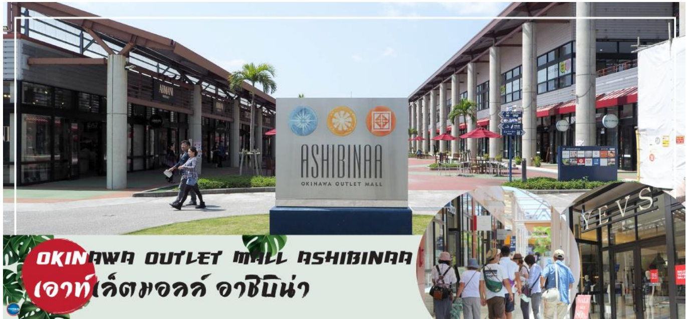
OKINAWA OUTLET MALL ASHIBINAA เอาท์เล็ตมอลล์ อาชิบิโน่า

เช้า รับประทานอาหารเช้า ณ ห้องอาหารของโรงแรม (5) นำท่านเดินทางสู่ ศาลเจ้านะมิโนะอุเอะ (Naminoue Shrine) (ใช้เวลาเดินทางประมาณ 10 นาที) ตั้งอยู่ ณ บริเวณที่เป็นพื้นที่ศักดิ์สิทธิ์ที่ใช้ในการสวดภาวนาอธิษฐานต่อเทพเจ้าที่สถิตย์อยู่ ณ อาณาจักรเจ้าสมุทรโพ้นทะเลมาแต่ครั้งโบราณ ในอดีตชาวเรือที่เข้าออก ณ ท่าเรือนาสะ (Naha Port) ซึ่งขณะนั้นเป็นศูนย์กลางการแลกเปลี่ยนค้าขายกับนานาประเทศ ทั้งจีน ประเทศทางตอนใต้เกาหลี และชวายามาโตะ มักจะแหงนหน้ามองขึ้นไปยังศาลเจ้าซึ่งตั้งอยู่บนหน้าผาสูงเพื่ออธิษฐานและแสดงความขอบคุณ ศาลเจ้านะมิโนะอุเอะได้รับความเสียหายจากการรบในโอกินาวะ (Battle of Okinawa) เมื่อครั้งสงครามแปซิฟิก แต่ได้รับการบูรณะฟื้นฟูในเวลาต่อมาเมื่อสงครามสิ้นสุดลง ปัจจุบันนี้ได้กลายมาเป็นศูนย์กลางแห่งศาสนาชินโตในจังหวัดโอกินาวะ ชาวญี่ปุ่นมักจะมาไหว้ขอพรเกี่ยวกับธุรกิจการงานให้เจริญรุ่งเรือง ร่ำรวย และมาสะเดาะเคราะห์ให้พ้นโชคร้าย จากนั้นนำท่านสู่ เอาท์เล็ตมอลล์ อาชิบิโน่า (Okinawa Outlet Mall Ashibinaa) (ใช้เวลาเดินทางประมาณ 30 นาที) เอาท์เล็ตแห่งแรกในโอกินาวะ รวบรวมร้านค้าชั้นนำกว่า 100 ร้าน ทั้งเสื้อผ้าแฟชั่น สินค้าแบรนด์เนม นาฬิกา ข้าวของเครื่องใช้ ของเล่น ทุกร้านจัดเต็มทั้งสินค้านำเข้าและรุ่นใหม่ ลดราคากระหน่ำกว่า 30-80% ให้ได้เดินช้อปปิ้งท้ายทวีปกันอย่างจุใจ ภายใต้บรรยากาศสบายๆ สไตล์รีสอร์ทริมทะเล หากช้อปปิ้งเหนื่อยสามารถขึ้นไปทานอาหารที่ชั้น 2 มีอีกหลายร้านที่คอยให้บริการ