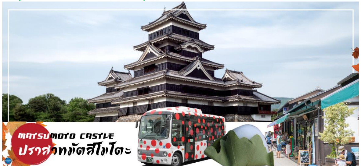
MATSUMOTO CASTLE ปราสาทมัตสึโมโตะ

จากนั้นนำท่านเดินทางสู่ คามิโคจิ (Kamikochi) (ใช้เวลาเดินทางประมาณ 50 นาที) แหล่งท่องเที่ยวทางธรรมชาติที่มีทิวทัศน์ภูเขาที่สวยงามที่สุดแห่งหนึ่งของประเทศญี่ปุ่น ดินแดนแห่งธรรมชาติท่ามกลางหุบเขาแสนสวยของเทือกเขา "เจแปน แอลป์" (Japan Alps) เป็นหุบเขาในฝันที่อยู่สูงขึ้นไปทางเหนือของเทือกเขาแอลป์ญี่ปุ่น ภาพสายน้ำของแม่น้ำอะซุสะ ที่ใสสะอาดไหลผ่านสะพานคัปปะ ล้อมรอบด้วยต้นป่าเขียวขจี และฉากหลังของยอดเขาสูงตระหง่านระดับ 3,000 เมตรให้ท่านได้เพลิดเพลินกับการเดินเล่นสบายๆ ไปกับธรรมชาติที่สวยงาม อิสระให้ท่านได้เก็บภาพความประทับใจตามอัธยาศัย สะพานคัปปะ-บะชิ เป็นจุดที่มีคนเยอะที่สุดในคะมิโคจิ และในบางครั้งก็ให้ความรู้สึกเหมือนทางแยกที่มีชื่อเสียงของชินญะ มีผู้คนมากมายเดินข้ามไปข้ามมาอยู่ไม่หยุดหย่อน มาถ่ายรูปใกล้กับสะพานหรือบนสะพาน นำท่านเดินทางสู่ เมืองมัตสึโมโตะ (Matsumoto) เป็นเมืองที่ใหญ่เป็นอันดับสองของจังหวัดนากาโนะ (ใช้เวลาเดินทางประมาณ 1 ชั่วโมง)