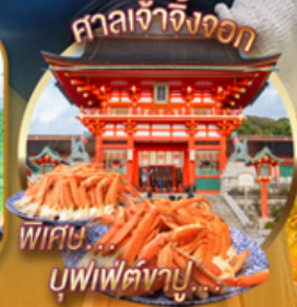
พิเศษ บัฟเฟ่ต์จ๊าบ

ว้าววว!! คามิโคจิ หุบเขาในฝันที่อยู่สูงขึ้นไปทางเหนือจาแอลป์ ญี่ปุ่น นั่ง Gondora lift ชมวิว HAKUBA IWATAKE MOUNTAIN RESORT เยือน วัดคิโยมิสึเดระ วัดน้ำใส ซุปป์ิงจุงุ ไอโดบะ และ ซินจุกุ ศาลเจ้าฟูชิมิอินาริ ศาลเจ้าเสาโทริอิพันต้นแห่งเกียวโต บัฟเฟ่ต์จ๊าบ