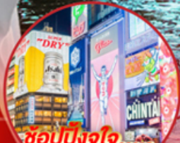
ช้อปปิ้งใจ..... Shinsalbashi

โอโห้!! ชมใบไม้เปลี่ยนสีที่สวยงามที่สุดในภูมิภาค ณ หมู่เขาโคริงเค อลังการไฟลันดวง ณ หมู่บ้านนาบะ โนะ ซาโตะ ชม หมู่บ้านมรดกโลกการ์นต์โดย UNESCO ณ หมู่บ้านชิราคาวาโตะ ปราสาทมัตสึโมโตะ เป็น 1 ใน 12 ปราสาทดั้งเดิมที่ยังคงสมบูรณ์และสวยงาม ชมสวนสไตล์ญี่ปุ่น และเยือน วัดกินคะคุจิ หรือ วัดเงิน แห่งเมืองเกียวโต