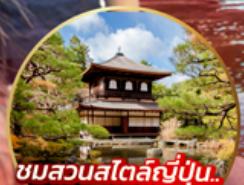
ชมสวนสไตลญี่ปุ่น.. Ginkakuji Temple