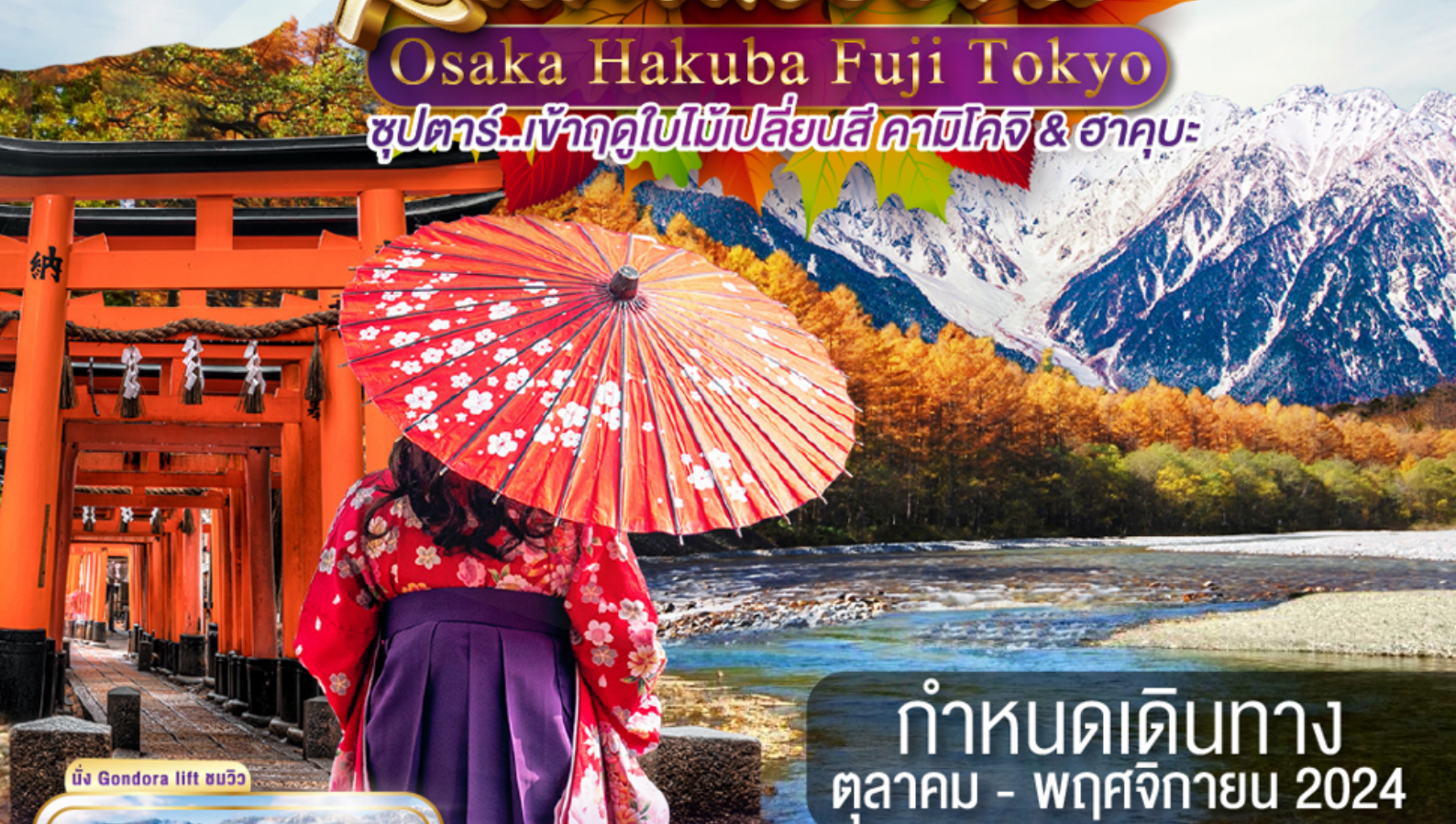
นั่ง Gondora lift ชมวิว

ซูปราร์..เจ้าฤดูใบไม้เปลี่ยนสี คามิโคจิ & ฮาคุบะ