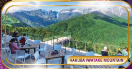
HAKUBA IWATAKE MOUNTAIN