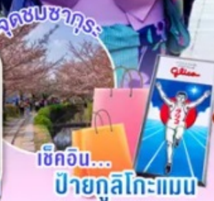
จุดชมซากุระ... ช้อปปิ้ง... ปายุกูลิโกะแมน