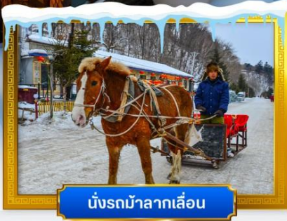
นั่งรถม้าลากเลื่อน