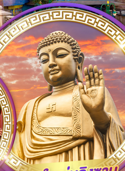
พระใหญ่หลิงชาน