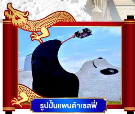
รูปปั้นแพนด้าเซลฟี