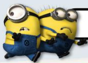
ZONE 5 : THE LOST WORLD