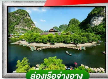
ล่องเรืออ่างฮาว