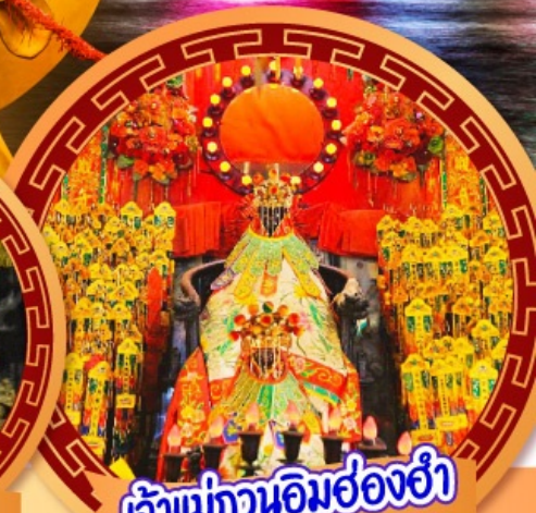
เจ้าแม่กวนอิมฮ่องฮ่า

นมัสการเจ้าแม่กวนอิมฮ่องฮ่า หมุนกังหันรับโชคลากเงินทองที่วัดแชงหมิว ขอพรความรักกับผู้เฒ่าจันทรธา วัดหวังต้าเซียน