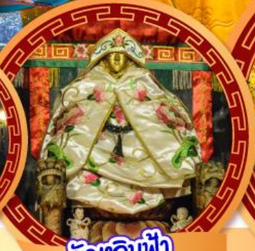
วัดเลินฟ้า