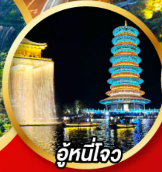
อู้หนี่ใจ