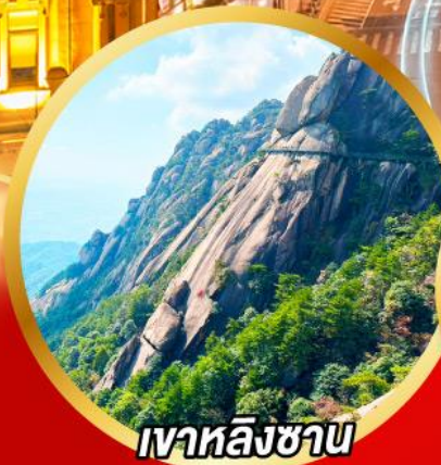
เขาหลิงซาน