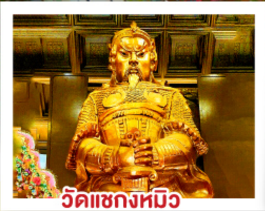
วัดแควงหมิว