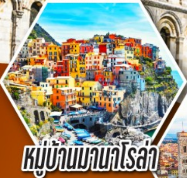
หมู่บ้านมานาโรล่า