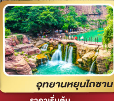
อุทยานหยุ่นโกซ่าน