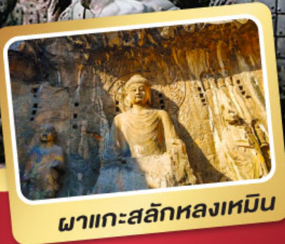
พลาเกาะสลักหลงเหมิน