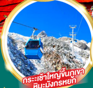
กระเช้าใหญ่ขึ้นภูเขา หิมะมังกรหยก