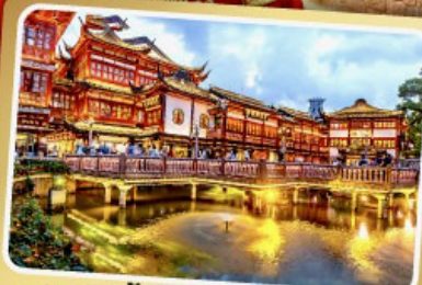
ตลาดร้อยปีเจิ้งหวังเหมียว