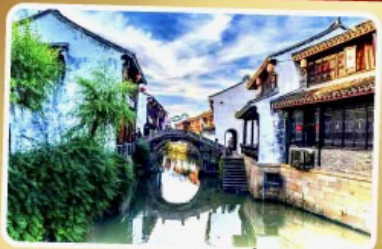
เมืองโบราณเยี่ยเหอ