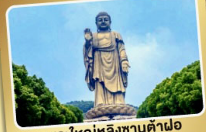
พระใหญ่หลิงซานต้าฝอ

เมนูพิเศษ! ซีโครงหมูอู๋ซี, เสี่ยวหลงเปา, ชาบูหมาล่า