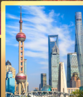
เซี่ยงไฮ้