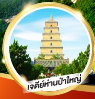
เจดีย์ห่านป่าใหญ่