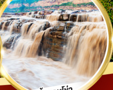
น้ำตกหูโจว