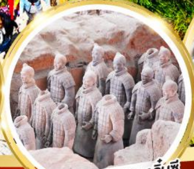
กองทัพทหารดินเผาจีนซี