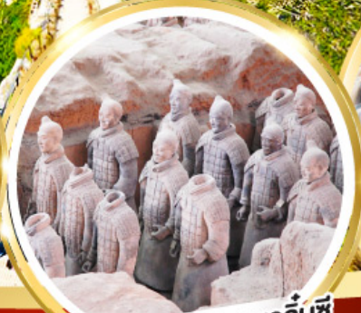
กองทัพทหารดินเผาจีนซี