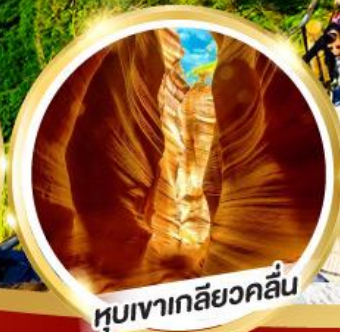
หุบเขาเกลียวคลื่น