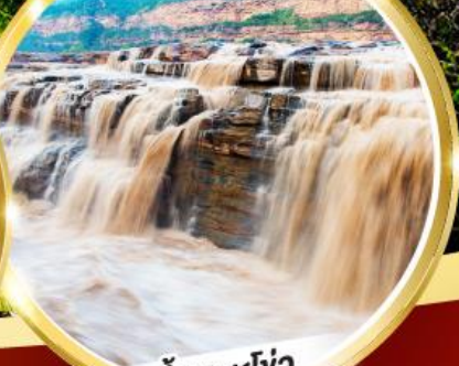
น้ำตกหูโง่