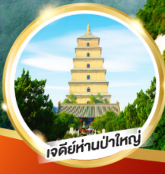
เจดีย์ห่านป่าใหญ่