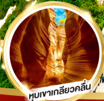
หุบเขาเกลียวคลื่น