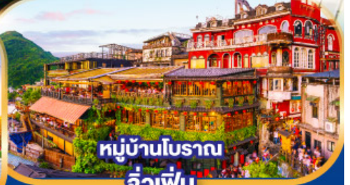
หมู่บ้านโบราณ จิวเฟิ่น