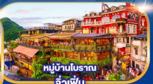
หมู่บ้านโบราณ จิวเฟิน