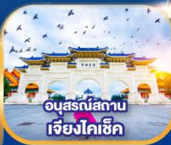
อนุสรณ์สถาน เจียงไคเช็ค