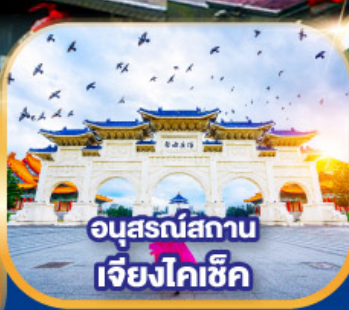
อนุสรณ์สถาน เจียงไคเช็ค