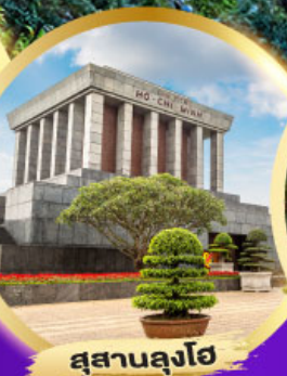
สุสานลุงโฮ