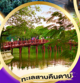
ทะเลสาบคินคาบ