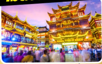
ตลาดร้อยปีเฉิงหวังเมี่ยว