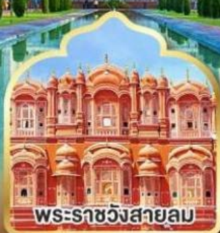
พระราชวังสายลม