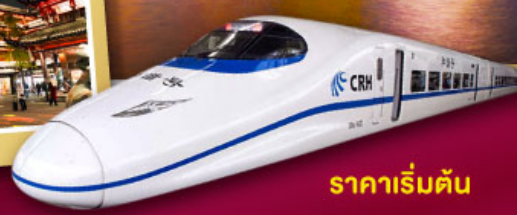
ราคาเริ่มต้น