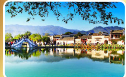
หมู่บ้านผดกโลก หงซุน