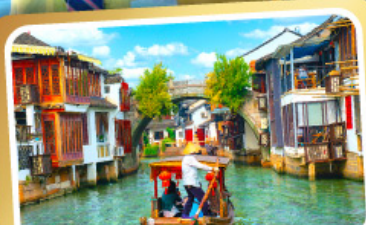
ล่องเรือเมืองโบราณซูโจวเจียเจียว