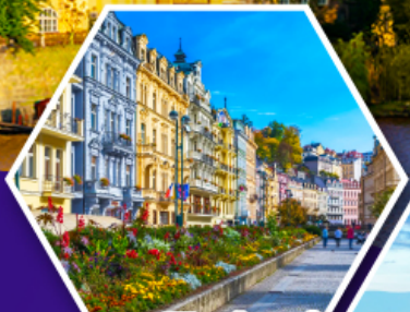
คาร์ลสไบวารี