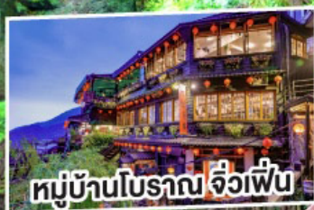
หมู่บ้านโบราณ จ๊วเพื่อน