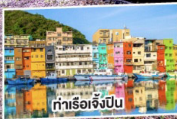
ท่าเรือเจ๋งป็น