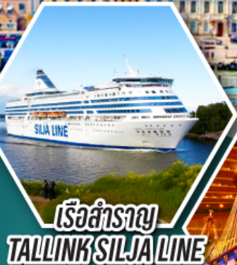
เรือสำราญ TALLINK SILJA LINE