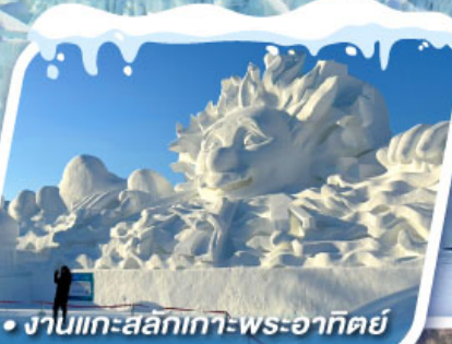
• งานแกะสลักเทวพระอาทิตย์

ชมดอกเกล็ดหิมะ อู๋ซัง ทัศนียภาพอัศจรรย์แห่งทะเลสาบกระจก จิ้งป้อหู