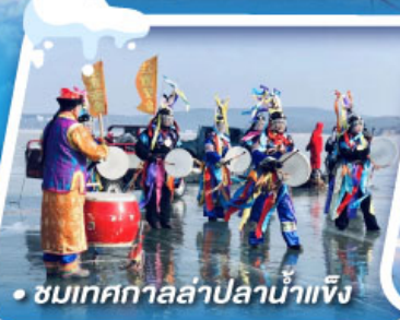
• ชมเทศกาลล่าปลาน้ำแข็ง

งานเทศกาลแกะสลักหิมะที่ใหญ่ที่สุดในโลก HARBIN ICE & SNOW FESTIVAL 2025 เที่ยวหมู่บ้านหิมะ ดินแดนหิมะอันสุดประทับใจ