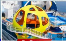
วันเดินทาง